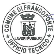
( Daniele INSERRA )