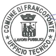
( Daniele INSERRA )